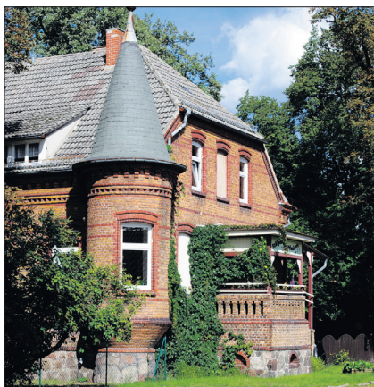
Das Gebäude der Stülper Kita liegt inmitten herrlicher Natur

derung angeboten. In spielerischer Weise lernen die Kinder englische Begriffe des Alltags. Auch Musik, Basteln oder Darstellen gehören zum Alltag bei den „Landmäusen“. Das wird bei den zahlreichen „Mäusefesten“ deutlich, sei es Fasching, Jahreszeitenfeste, Mäusegeburtstag oder Zuckertütenfest. Die erwachsenen „Landmäuse“ und Familienmitglieder werden in alle Projekte und Feste mit einbezogen. Besonders freuen sich ältere Menschen, wenn sie ein Ständchen anlässlich eines runden Geburtstages oder einer Goldhochzeit von den Kleinen dargeboten bekommen. Auch bei Dorf- und Feuerwehrfesten rund um Stülpe ist das Engagement der „Landmäuse“ nicht mehr wegzudenken.