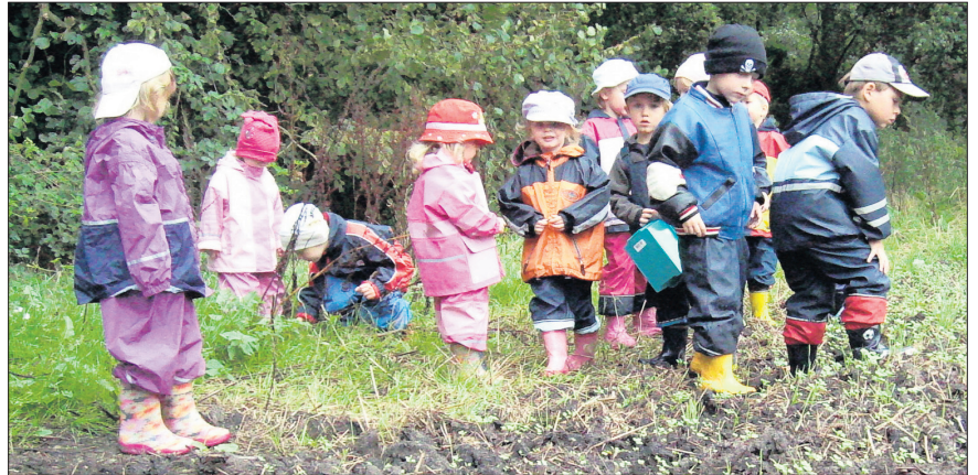
Die kleinen „Landmäuse“ auf Schneckenuche in Wald und Flur

Die jüngsten Einwohner unserer Gemeinde werden in sechs Kindertagesstätten betreut, und zwar in den Ortsteilen Felgentreu, Hennickendorf, Jänicken-